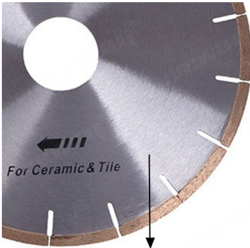
Silent Steel Blank Type, Low Noise when Cutting