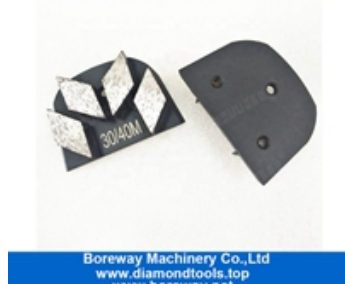
Patins de meulage à quatre segments