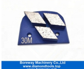
Chaussures de meulage à trois segments