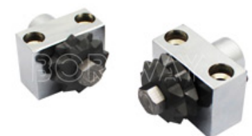
Rich Styles Bush Hammer Plate