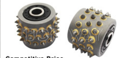
Competitive Price & Superior Quality