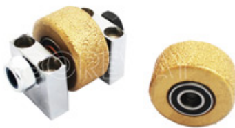
Safe And Non-Slip Effect On Natural Stone Slab