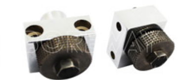
Large Number Of Grinding Squares