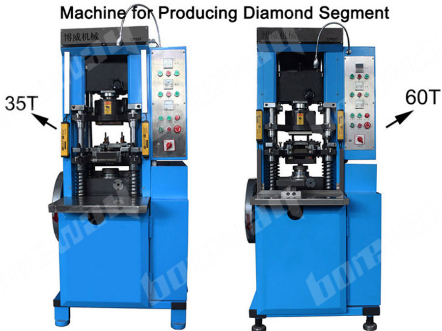
Cold Pressing Machine