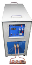
Three Phase 380V 30kW High Frequency Induction Welding Machine