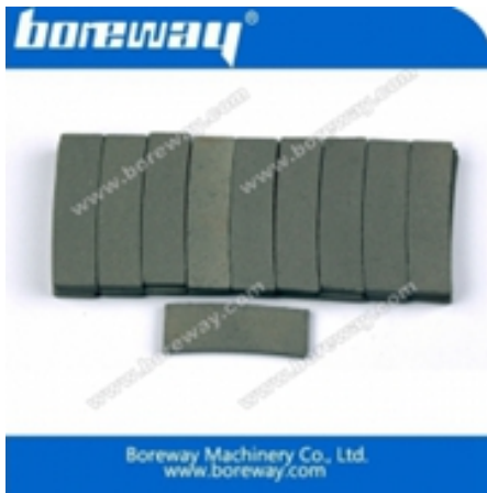
Segment de coupe des bords pour le granit