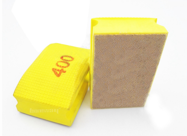
Boreway Machinery Co.,Ltd www.fordiamondtools.com www.diamondtools.top

Coussinets plus connexes, Pls cliquez ici: Tampons de polissage diamantés à la main