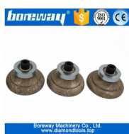
Fraise diamantée continue O20xM10