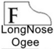
F LongNose Ogee