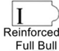
I Reinforced Full Bull