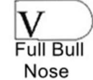
V Full Bull Nose