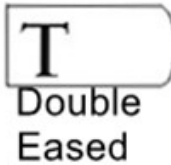
T Double Eased