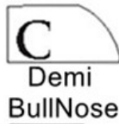
C Demi BullNose