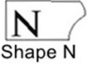
N Shape N