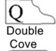
Q Double Cove