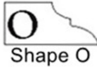
O Shape O