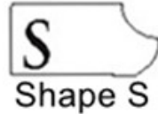
S Shape S