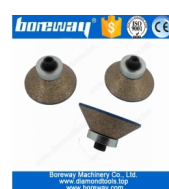
Peu de routeur continu en métal de diamant