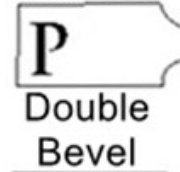
P Double Bevel