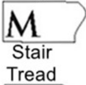
M Stair Tread