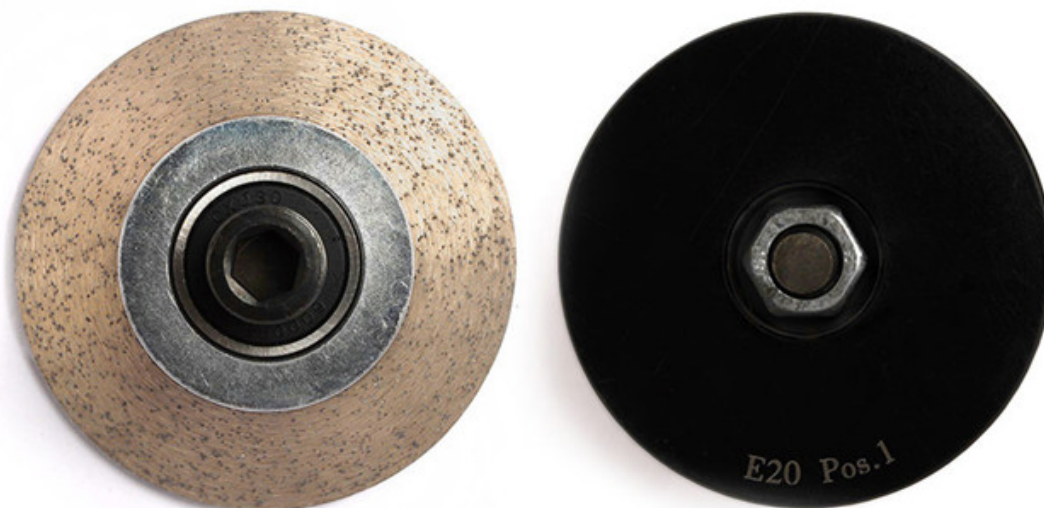
M10 Thread Diamond Profile Wheel