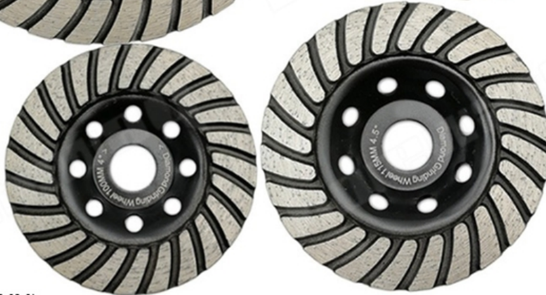
4 Inch (D100MM)