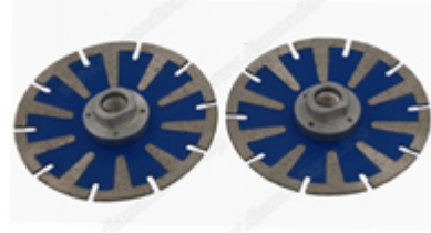
Segment de diamant à fente en U de 350 mm

Boreway Machinery Co., Ltd www.diamondtools.top www.boreway.com