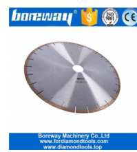
Lame de scie diamantée pour disque de coupe humide de 12 pouces