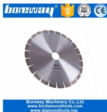
Disque de coupe à dents tranchantes lame de scie en grès