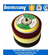
Coussin de soutien en mousse de 5 pouces