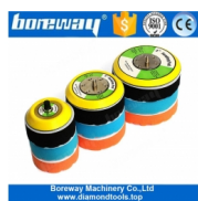
Patin de soutien fileté 5/16 "-24