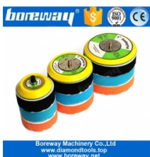
Patin de soutien fileté 5/16 "-24