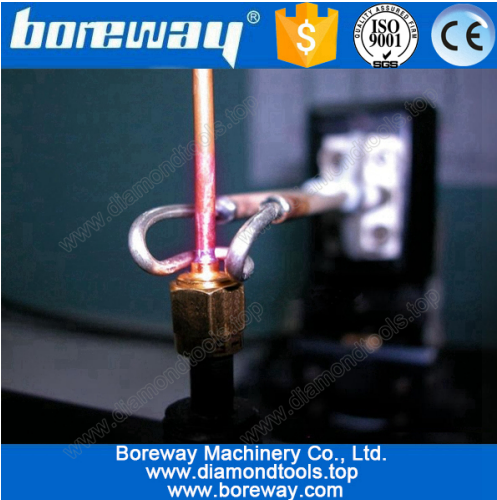
Copper tube welding