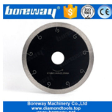
Disque de coupe à segments pressés à chaud de 5 pouces