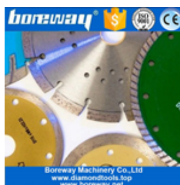
Lames de scie segmentées diamantées à coupe transversale