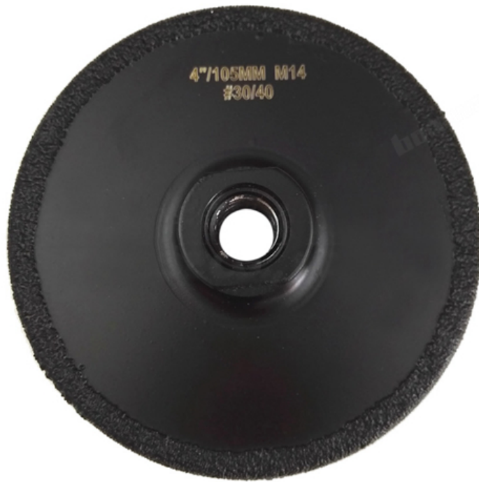
M14 Thread Vacuum Brazed Diamond Grinding & Cutting Wheel

Boreway Machinery Co., Ltd. www.diamondtools.top www.boreway.com