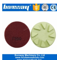
Almohadillas de pulido de piso de diamante de 3 pulgadas