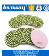
Almohadillas de pulido de pisos de concreto de resina adhesiva