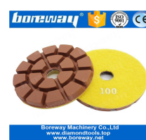
Almohadillas de pulido de resina para piso de diamante