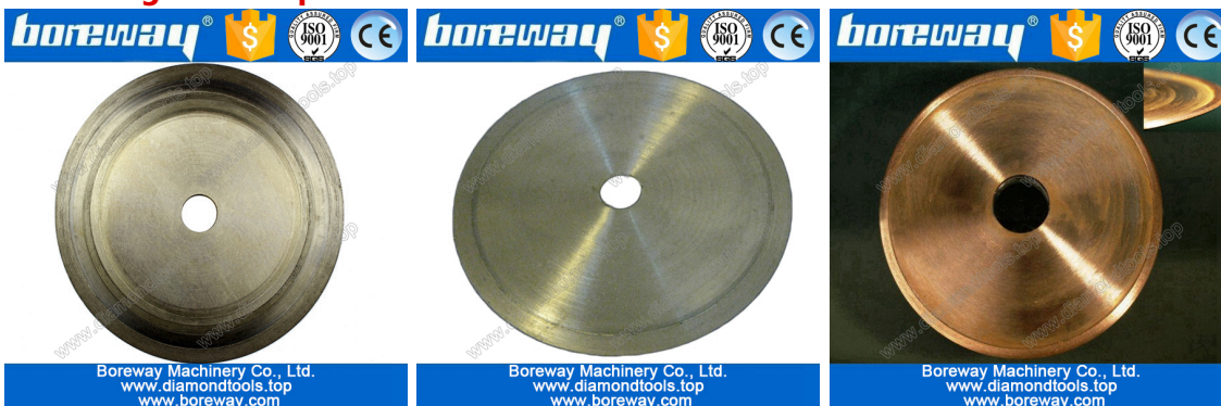
Boreway Machinery Co., Ltd. www.diamondtools.top www.boreway.com Electroplate jade cutting blade

Si no ve el producto que desea, por favor, póngase en contacto con nosotros para obtener más imágenes de productos.