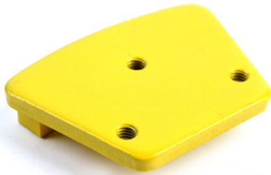
3 X M6/M8 Thread Holes