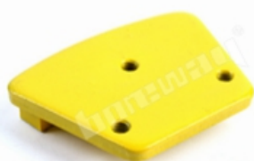
3 X M6/M8 Thread Holes