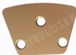
3 X Bare Holes