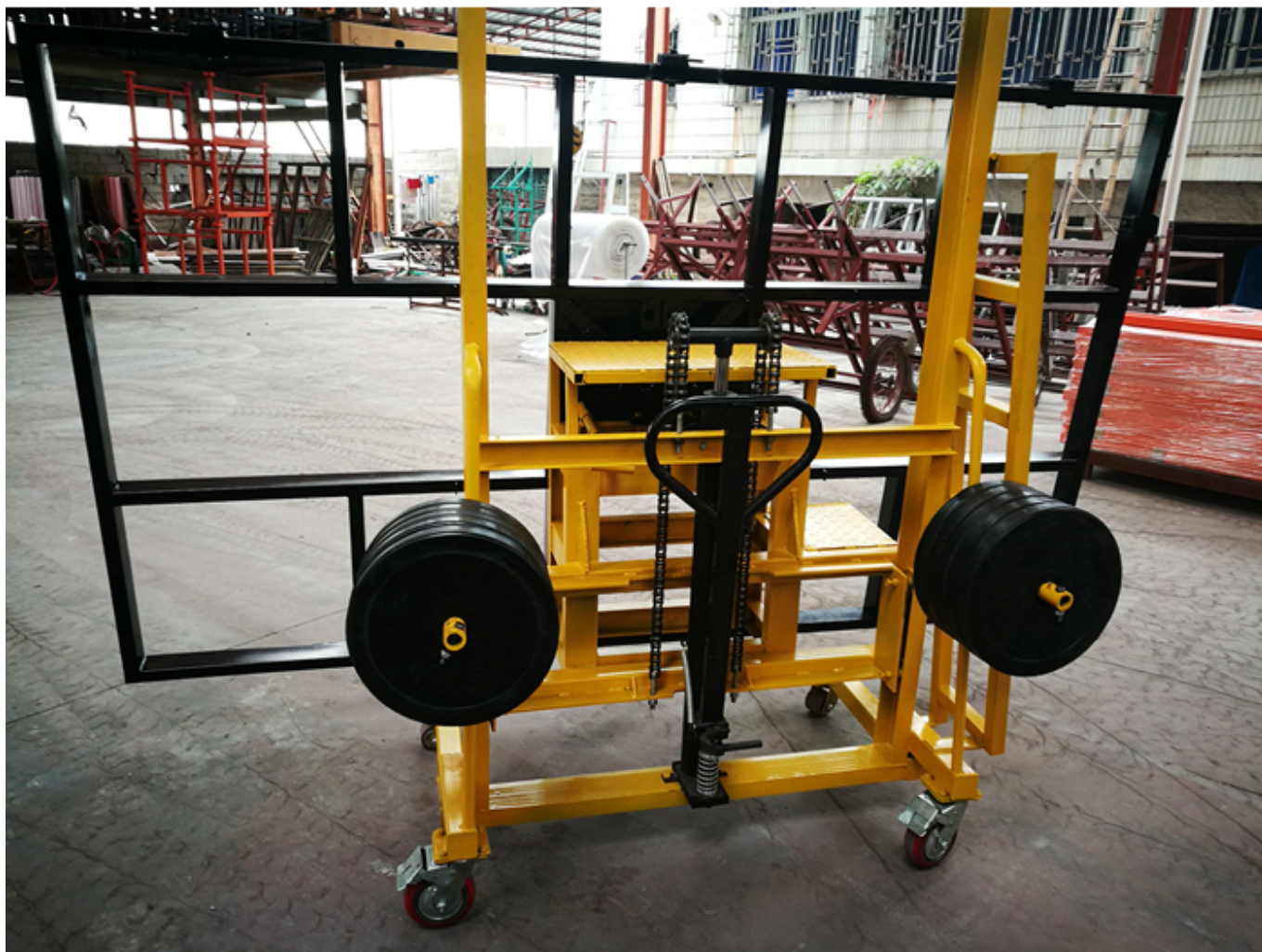
Embalaje & entrega