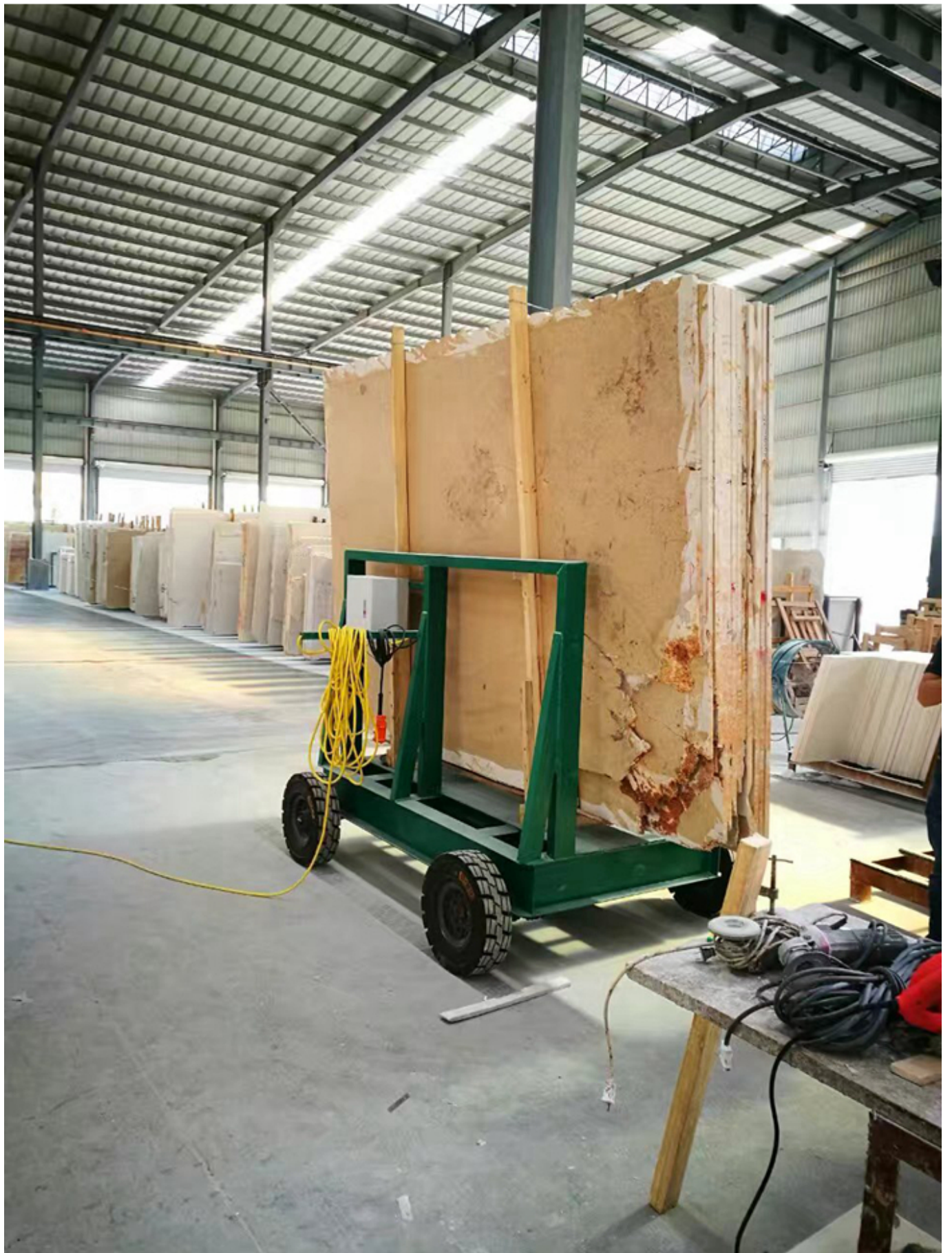
Embalaje & entrega