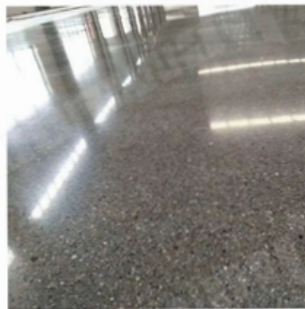
After Grinding and Polishing