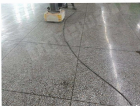
Before Grinding and Polishing