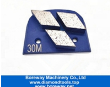
Rectificado de tres segmentos