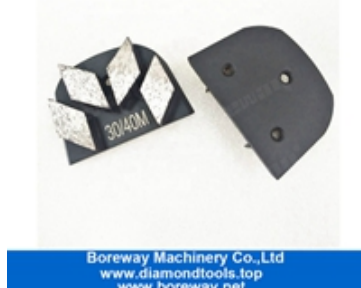
Rectificado de cuatro segmentos