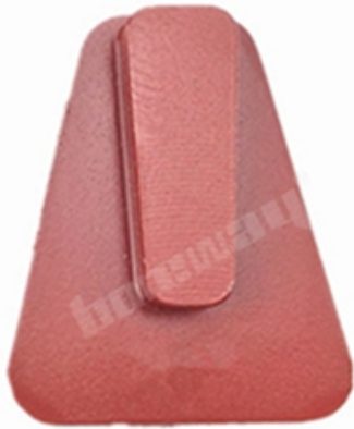
Husqvarna Redi Lock Blank