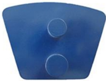
Two Round Pins Redi Lock Blank