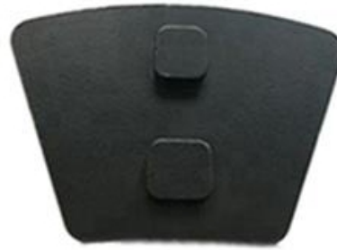
Two Square Pins Redi Lock Blank