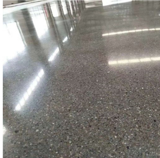
After Grinding and Polishing