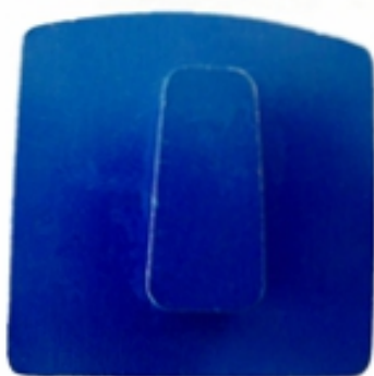
Husqvarna Redi Lock Blank

Almohadilla abrasiva de diamante Ready Lock Metal Bond Aplicación de todo tipo de pavimentos de hormigón y terrazo antes del pulido, preparación para lijado fino de suelos o rehabilitación de suelos antiguos. Adecuado para uso de esmerilado general (hormigón, piedra), mientras que en su mayoría se utilizan para pintura, pegamento, eliminación de epoxi y revestimiento de pisos, alta calidad y alta eficiencia, larga vida útil.