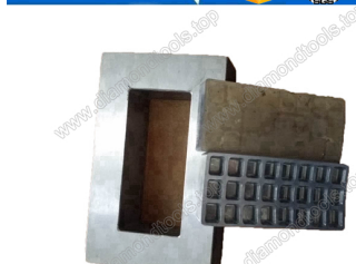
Mould for diamond floor grinding blocks

Boreway Machinery Co., Ltd. www.diamondtools.top www.boreway.com