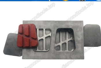
Mould for diamond floor grinding blocks

Boreway Machinery Co., Ltd. www.diamondtools.top www.boreway.com