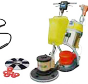
Floor polishing machine