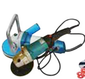
hand polishing machine

Compatible con la máquina: máquinas de molienda planetarias activas, molinillo planetario pasivo, máquina de pulido, molinillo de ángulo, depurador del piso.