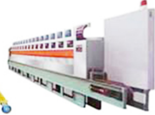
Ceramics polishing machine