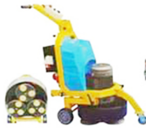
Large floor polishing machine