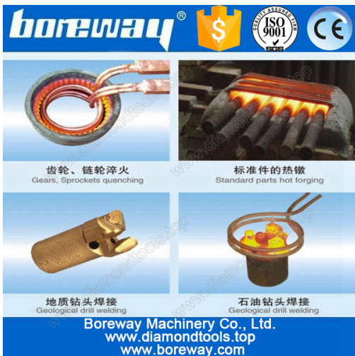
A variety of materials welding

Anexo: interruptor de pie / interruptor de presión manual, serpentín de calentamiento (se puede personalizar), tuberías de agua, bombas de agua (se debe comprar).