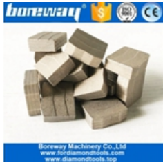
Segmento de corte de bloque de granito