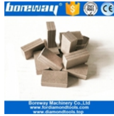
Segmento de corte de bloques de mármol