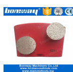
2 Redondo Molienda Zapatos