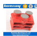
3 ronda Molienda Zapatos