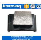
1 Grande Cuadrado Molienda Zapatos