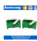
Zapatos de molienda de 2 barras