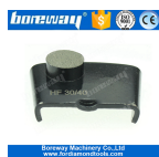
1 ronda Molienda Zapatos