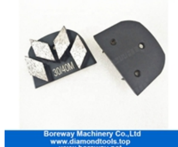
Rectificado de cuatro segmentos