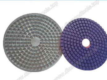
Mould for diamond resin polishing pads

Boreway Machinery Co., Ltd. www.diamondtools.top www.boreway.com