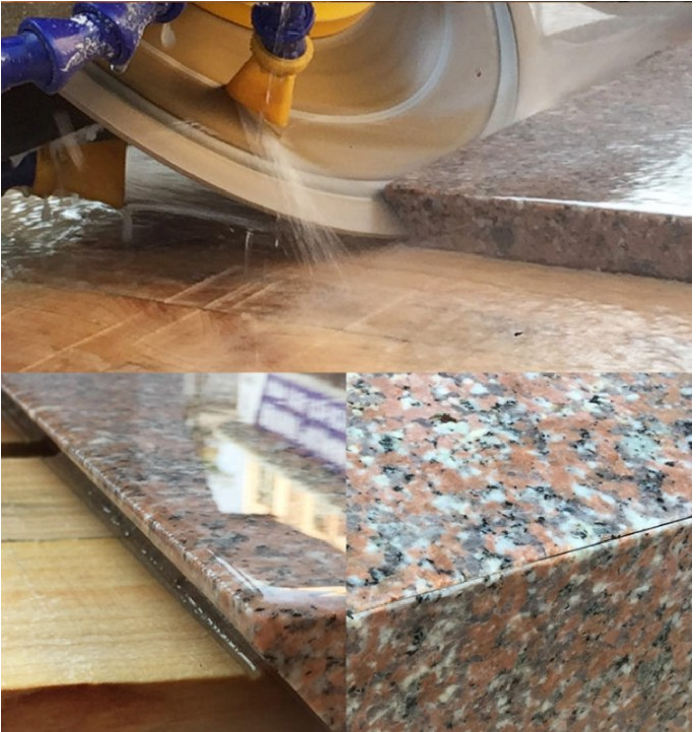
Proveedor de corte de segmento de diamante en China , Efecto de corte de productos: