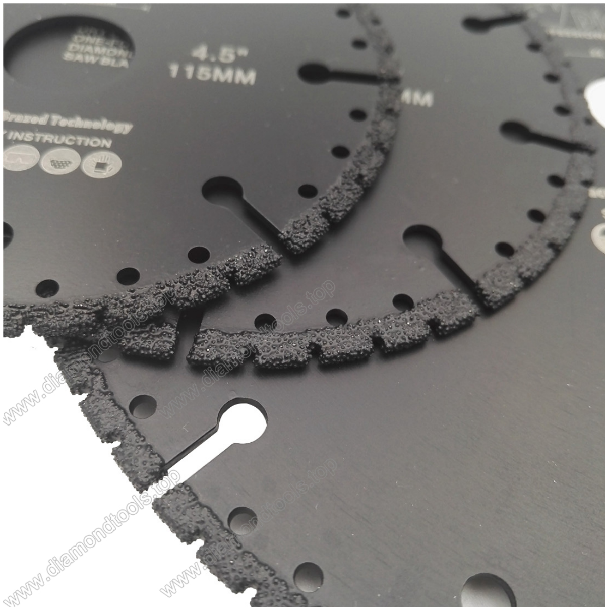
Disco de diamante soldado al vacío de 115 mm para cuchilla de demolición de uso