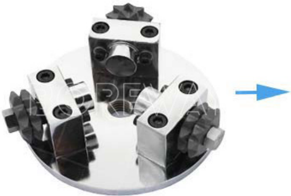
20S Star Bush Hammer Plate