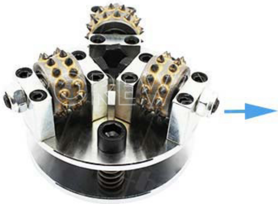
Carbide Alloy Bush Hammer Plate