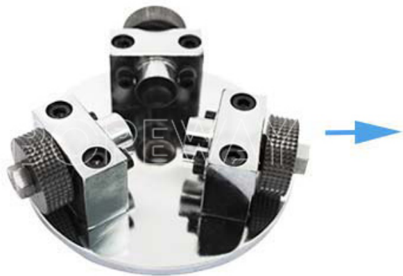
Hundred Teeth Bush Hammer Plate