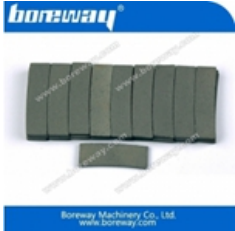
Segmento de corte de bordes para granito