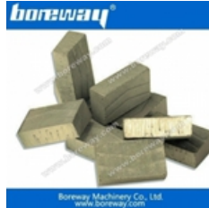
Segmento de corte de bloques para mármol