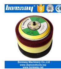
Almohadilla de respaldo de espuma de 5 pulgadas