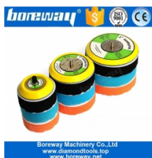
Almohadilla de respaldo de rosca de 5/16 "-24