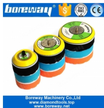
Almohadilla de respaldo de rosca de 5/16 "-24