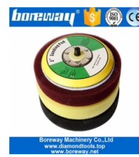
Almohadilla de respaldo de espuma de 5 pulgadas