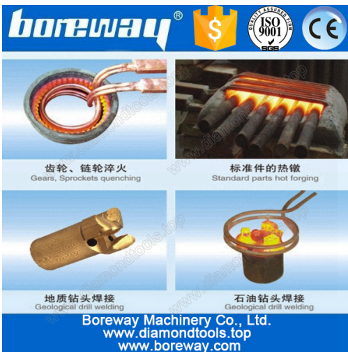
A variety of materials welding

Anexo: Interruptor del pie / interruptor de la mano-prensa, bobina de la calefacción (puede ser modificado para requisitos particulares), pipas de agua, bombas de agua (necesidad de comprar).