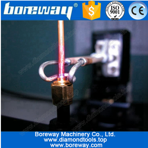
Copper tube welding