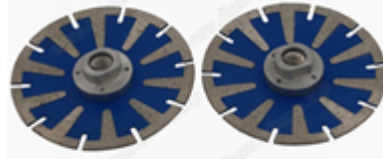
Segmento de diamante con ranura en U de 350 mm

Boreway Machinery Co., Ltd. www.diamondtools.top www.boreway.com