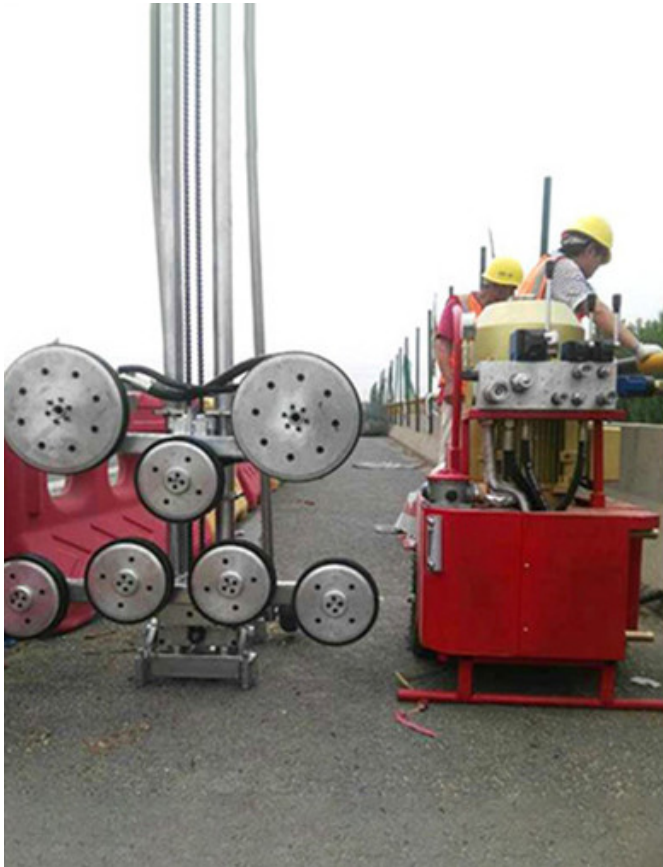
Imagen de la escena