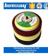
Almohadilla de respaldo de espuma de 5 pulgadas