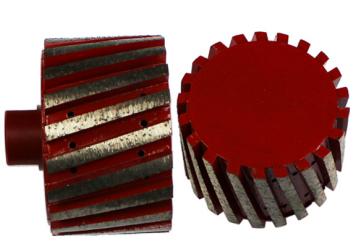
Boreway Machinery Co., Ltd. www.diamondtools.top www.boreway.com