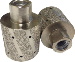
Boreway Machinery Co., Ltd. www.diamondtools.top www.boreway.com