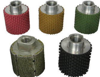
Boreway Machinery Co., Ltd. www.diamondtools.top www.boreway.com