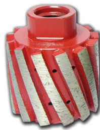
Boreway Machinery Co., Ltd. www.diamondtools.top www.boreway.com