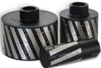
Boreway Machinery Co., Ltd. www.diamondtools.top www.boreway.com