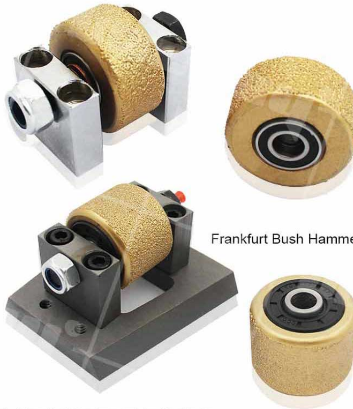
Frankfurt Bush Hammer Roller