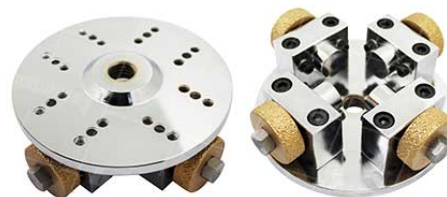
Single Layer Plates