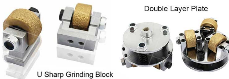
U Sharp Grinding Block