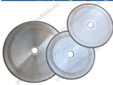
Straight teeth jade cutting blade

Boreway Machinery Co., Ltd. www.diamondtools.top www.boreway.com