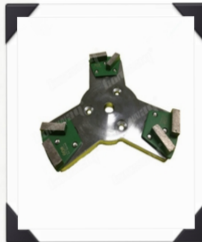
Two Oval Segments with Stripes

Wenn Sie sich für unsere Produkte interessieren, können Sie mich anklicken.