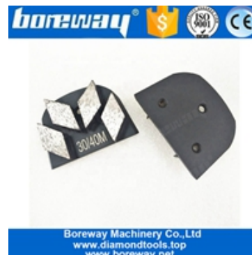
Vier Segmente Schleifschuhe