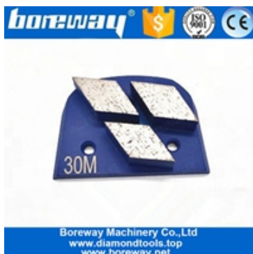
Drei Segmente, die Schuhe schleifen