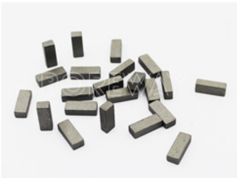
Gang Blade Segment